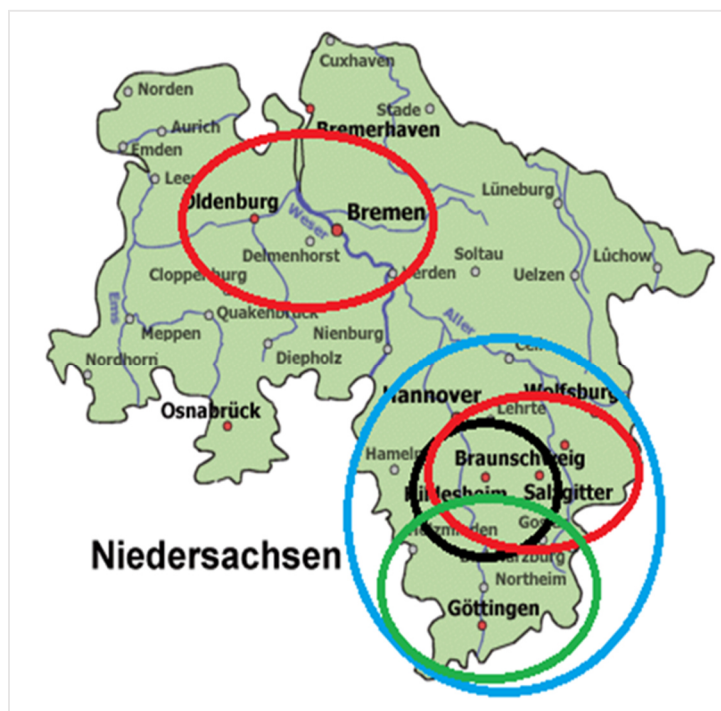
Abbildung 11: Wirkungsbereiche der Projekte

Projektziel der Zuwendungsempfänger mit dem grünen und schwarzen Kreis war es jeweils, den Absatz an Regionalprodukten zu erhöhen. Beim grünen Kreis ging es um den Aufbau einer regionalen Erzeugergemeinschaft zum Zweck der gemeinsamen Vermarktung und beim schwarzen um den einer regionalen Vermarktungsinitiative. Der Zuwendungsempfänger mit den roten Kreisen sollte den